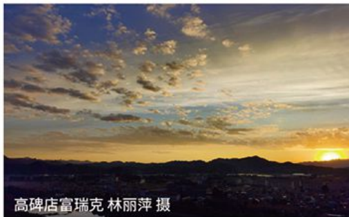
高碑店富瑞克