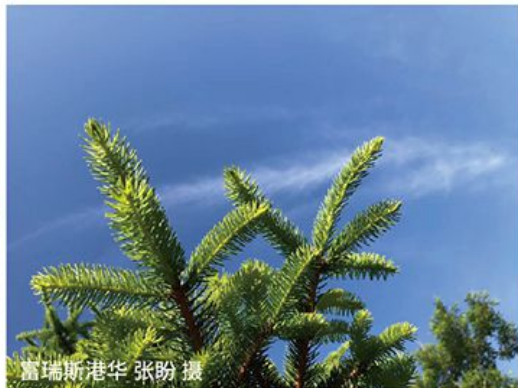
富瑞斯港华