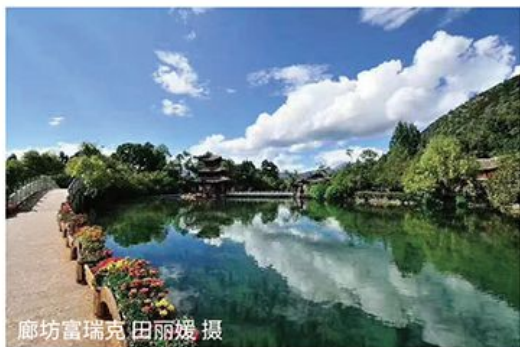
廊坊富瑞克 田丽媛 摄