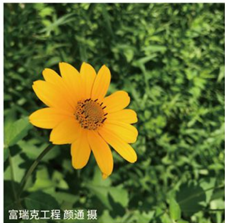
富瑞克工程