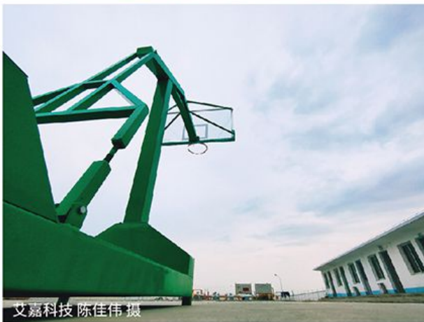
艾嘉科技 陈佳伟 摄