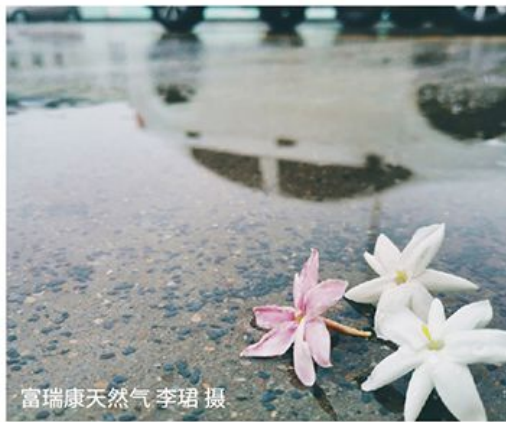
富瑞康天然气