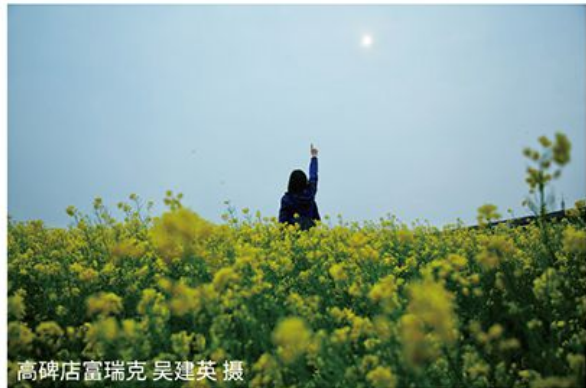
高碑店富瑞克