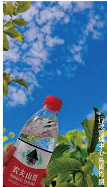
行政管理中心 马肖肖 摄