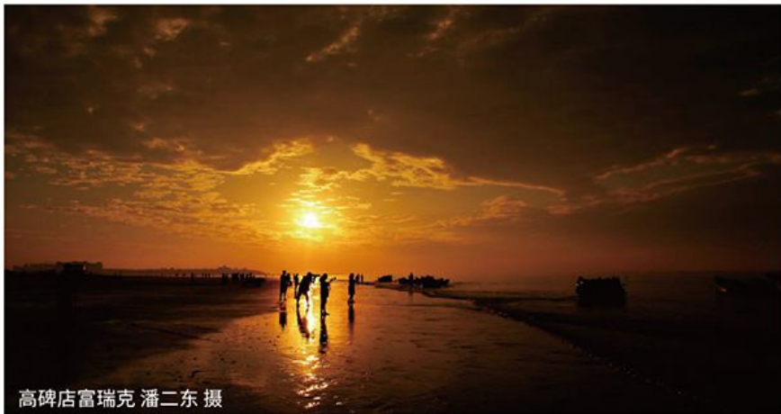
高碑店富瑞克